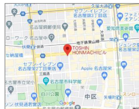
ニッショー栄支店様（広小路本町交差点）を南へすぐ